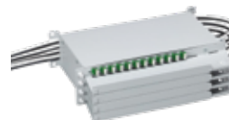
SPM ST 2HE