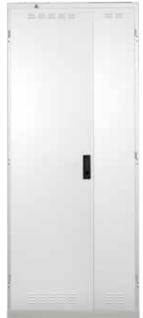
ODF ST geschlossen